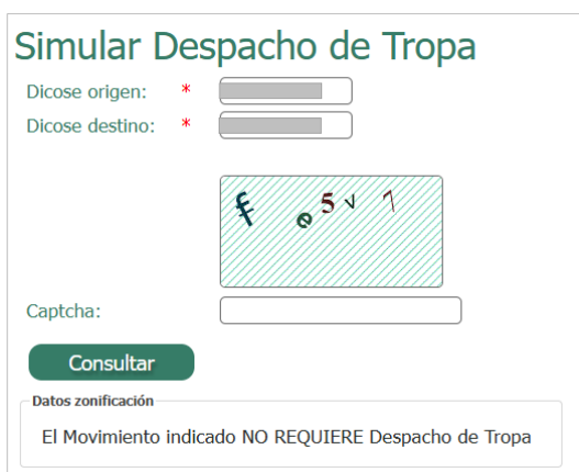
Imagen 3.3. Simulación: movimiento que no requiere Despacho de Tropa